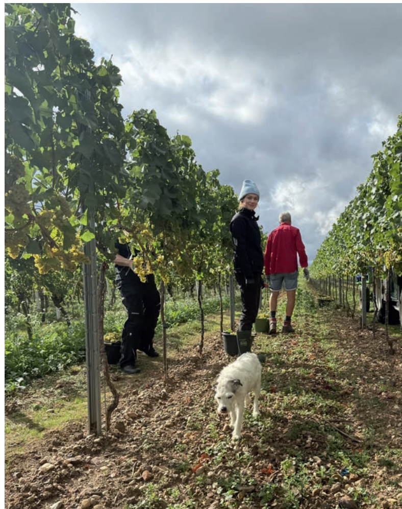
Chardonnay wie im Bilderbuch am 2.9.2025

2025 war kein Jahr für schnelle Effekte, sondern für Weine, die bleiben. Entsprechend gespannt sind wir auf die Weine mit langer Ausbauzeit, die jetzt noch in unserem Barriquefasskeller liegen – und auf die Geschichte, die sie in einigen Jahren über diesen Jahrgang erzählen werden.